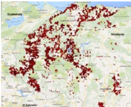
Puntos GPS de las estufas de Proyecto Mirador en Honduras.