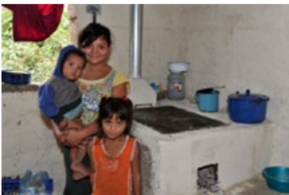
Una estufa Dos por Tres y los beneficiarios.