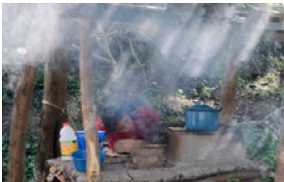
Un fogon tradicional en Honduras.